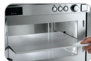
Secondo piano estraibile per i modelli NE 2143-2 e NE 2153-2 Removable intermediate shelf for models NE 2143-2 e NE 2153-2